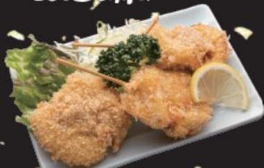
まぐろ串カツ 300円(税込330円)