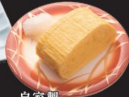
自家製 だし巻き玉子 250円(税込275円)