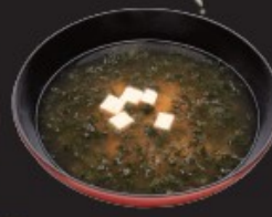
あおさ汁 200円(税込220円)