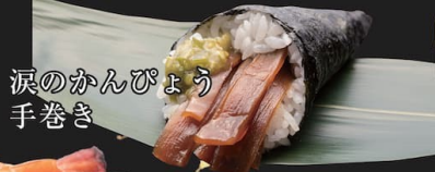
涙のかんぴょう手巻き