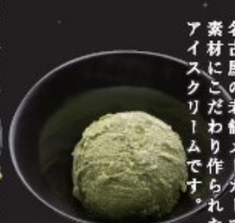
抹茶アイス 350円(税込385円)