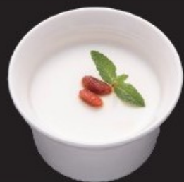
手作り 杏仁豆腐 300円(税込330円)