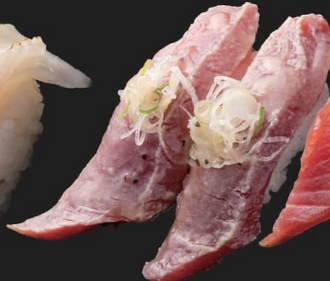
まぐろ塩だれ炙り