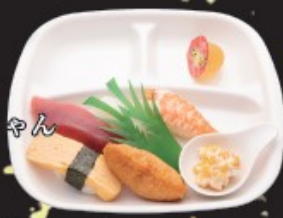
ウメちゃん セット 580円 (税込638円)