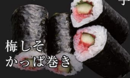
梅しそかっぱ巻き