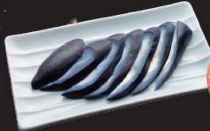
なすのお漬物 250円(税込275円)