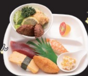
タケちゃん セット 630円 (税込693円)