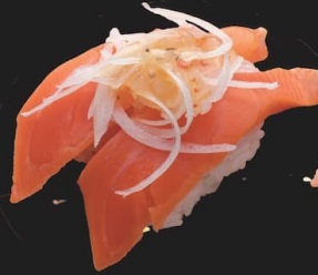
サーモンパッチョ