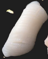
ジャンボ 紋甲いか(1貫)