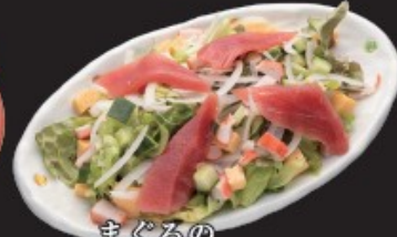
まぐろの カルパッチョ風サラダ 450円(税込495円)