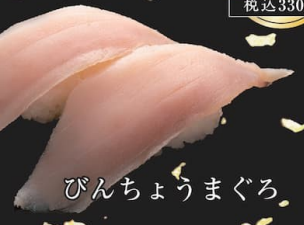
びんちょうまぐろ