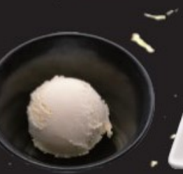
バニラアイス 300円(税込330円)