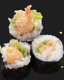
えびフライ巻 中巻