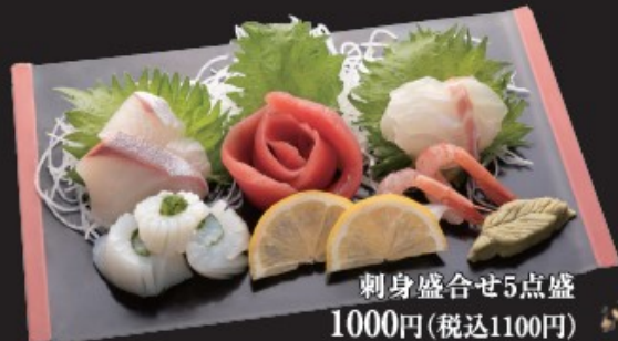
刺身盛合せ5点盛 1000円(税込1100円)