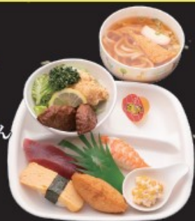
ショウちゃん セット 730円 (税込803円)