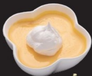
手作り マンゴープリン 300円(税込330円)