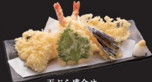
天ぶら盛合せ 950円(税込1045円)