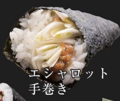
エシャロット手巻き