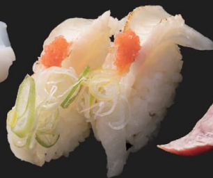
かれい えんがわ炙り