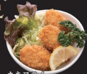
カキフライ 450円(税込495円)