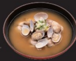
あさり汁 250円(税込275円)