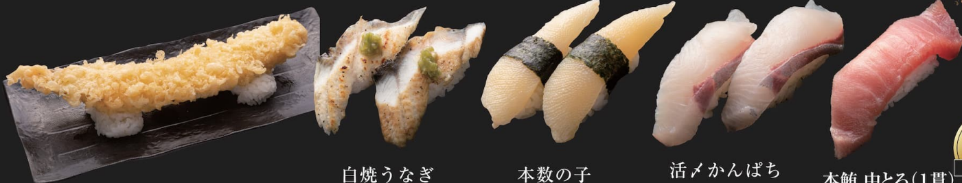
特大あなご天握り