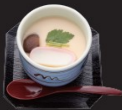
茶碗蒸し 350円(税込385円)