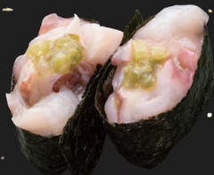
北海道産 水たこ使用 たこわさび軍艦