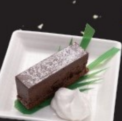
ガトーショコラ 350円(税込385円)