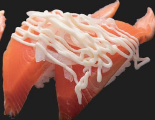
サーモンオニオン