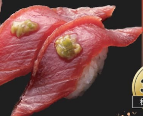
自家製漬けまぐろ