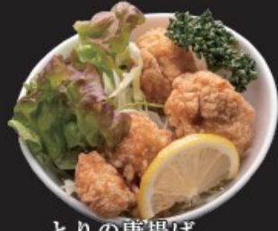
とりの唐揚げ 450円(税込495円)