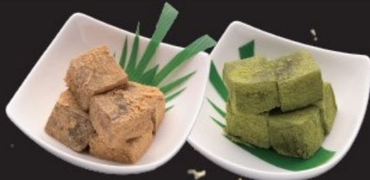
わらび餅(黒糖・抹茶) 各300円(税込330円)