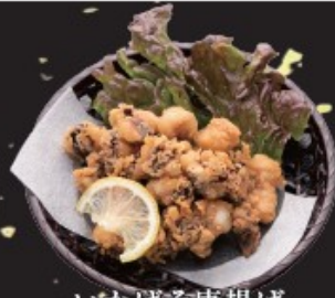
いかげそ唐揚げ 350円(税込385円)