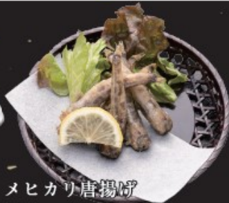
メヒカリ唐揚げ 350円(税込385円)