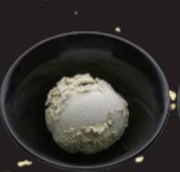
ピスタチオアイス 350円(税込385円)