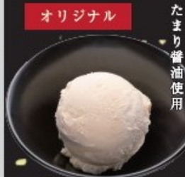
オリジナル たまりアイス 350円(税込385円)