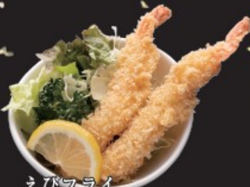
えびフライ 450円(税込495円)