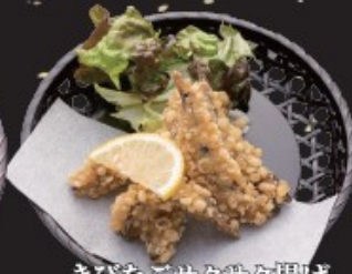
きびなごサクサク揚げ 400円(税込440円)