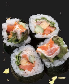
サーモンクリームチーズ巻