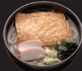
きつねうどん 450円(税込495円)